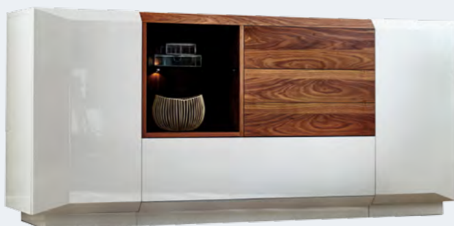
Vitrine mit 2 Glastüren B/H/T ca. 90/200/46 cm. Sideboard mit 3 Türen und 3 Schubkästen B/H/T ca. 220/90/50 cm.

AMBIENTE GARANTIERT. Mit den attraktiven Einzelmöbeln von MONDO PRISMA MEDIA können Sie besser fernsehen, müssen es aber nicht. Die Sideboards und Vitrinen begleiten als vollwertige Speisezimmermöbel auch gerne Unterhaltungen bei Tisch und flankieren anspruchsvolle Tafelrunden – ganz ohne TV.