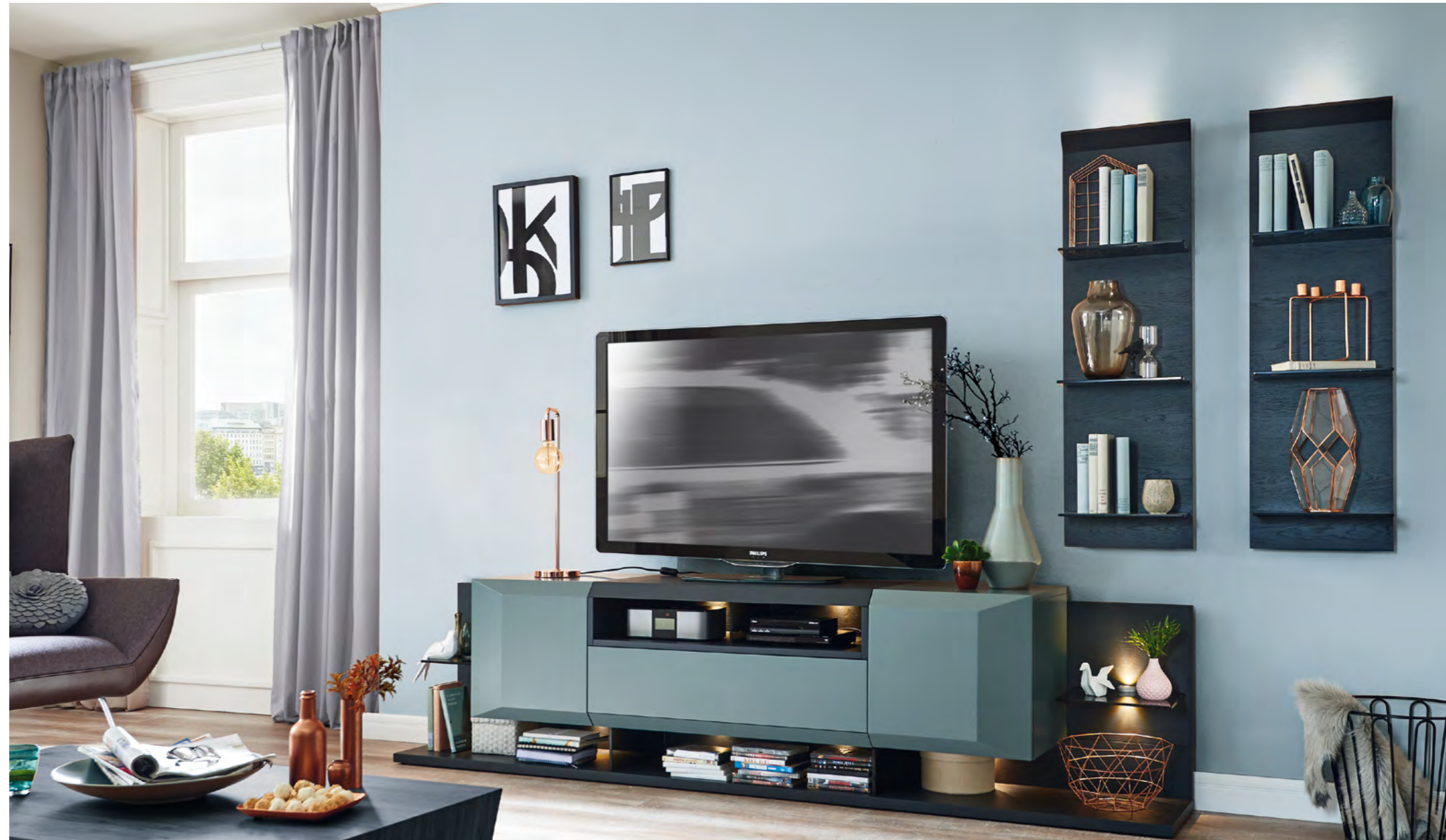
Vorschlagskombination SP3 Breite ca. 300 cm. (Beleuchtung optional)