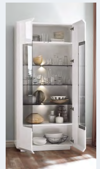
Vitrine mit 2 Glastüren B/H/T ca. 90/200/46 cm. Vorschlagskombination SP2 Breite ca. 295 cm. (Beleuchtung optional)