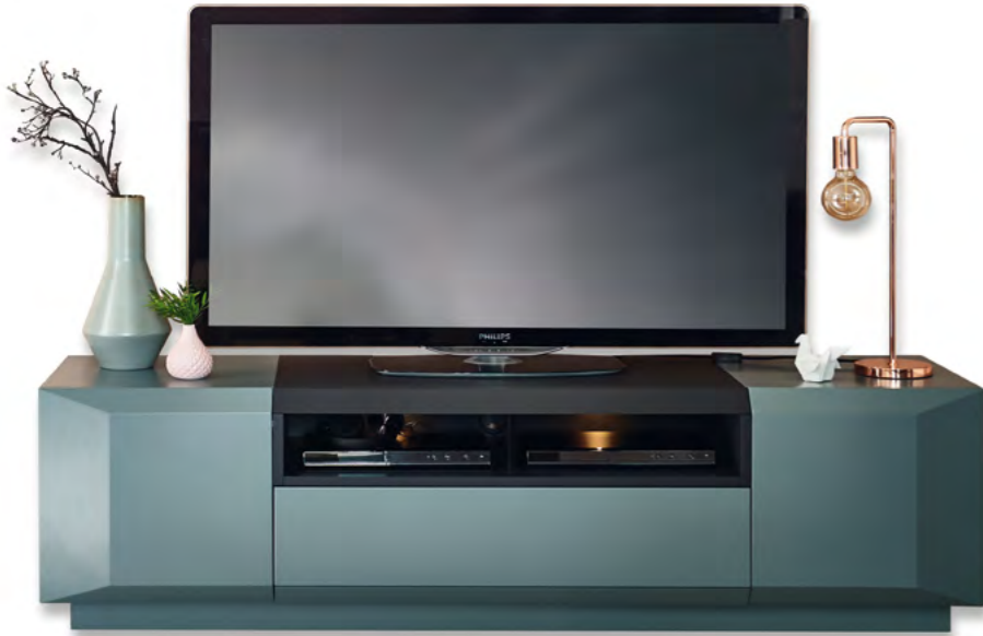
Lowboard hoch mit 3 Türen, B/H/T 180/50/50 cm. (Nischenbeleuchtung optional)