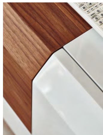
Farblich abgesetztes mittleres Deckblatt.