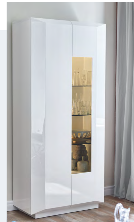
Vitrine mit einer Glastür.