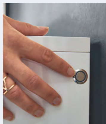
Lichtschalter mit Dimmer.