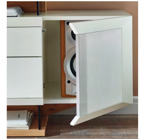
Soundfronten (Lochblech in Frontfarbe lackiert)