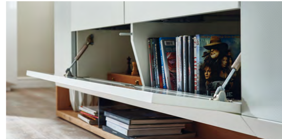
Übersichtliche Klappenfächer mit stabilen Beschlägen.