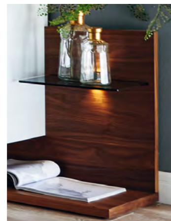
Winkelpaneel mit beleuchteten Glasböden.