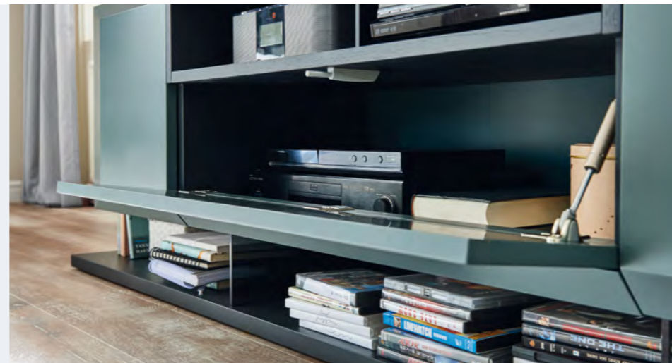
Viel Stauraum für Geräte, CDs und DVDs.

Kabel, Soundanlage, Receiver, Fernbedienung – MONDO PRISMA MEDIA sorgt für cleveres Kabelmanagement und geordnete Unterbringung. Alle TV-Unterteile werden serienmäßig mit einer Kabelleiste ausgestattet.