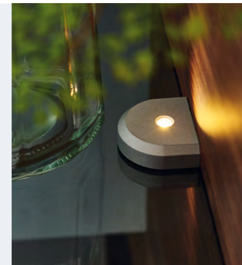
Innovative LED Lichtlösungen.